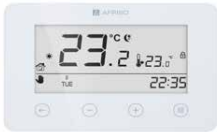
Thermostat programmable radio RT05 F