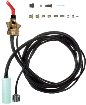
Ensemble d'aspiration Euroflex