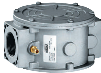
DN 15 à DN 50